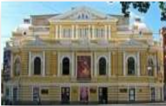
Театр ім. Шевченка

П. Зюскінд). Одним із найвідоміших популярних експериментальних авангардних театрів був Львівський театр ім. Л. Курбаса під керівництвом В. Кучинського. На початку 1990-х рр. в Україні з'явилась когорта молодих режисерів, які творили альтернативне мистецтво не в студіях, а в системі державних театрів: на малій сцені Національного академічного драматичного театру ім. І. Франка поставив свою першу виставу А. Жолдак; Державний угорський театр у Береговому очолив А. Вінянський (нині головний режисер Національного театру в Будапешті). У Київському Державному театрі драми й комедії на лівому березі під керівництвом Е. Митницького виросла плеяда режисерів-експериментаторів (Д. Богомазов, Ю. Одинокій, Д. Лазорко), які нині успішно працюють у різних театрах України і за кордоном. Кілька спроб створити новий тип авангардного театрального колективу було здійснено в Харкові, зокрема на Малій сцені Харківського театру ім. Т. Г. Шевченка (одна з кращих постановок на цій сцені – вистава «Маклена Граса» за М. Кулішем режисера С. Пасічника). Слайд 17.